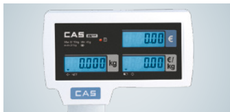
Hinterleuchtete Anzeigen auf Bediener- und Kundenseite mit Abschaltautomatik