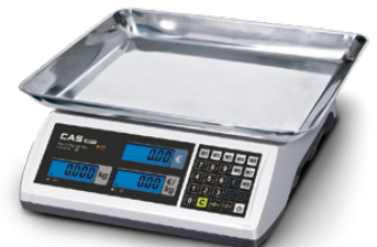
Warenschale ideal für lose Waren – 360×280×55 mm