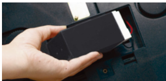
Bis zu 200 Stunden Betriebszeit* mit dem optionalen Hochleistungsakku