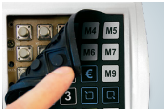
Leichtgängige mechanische Tasten unter der wasserabweisenden Softtouch-Tastaturmatte garantieren ein präzises, ermüdungsfreies Bedienen